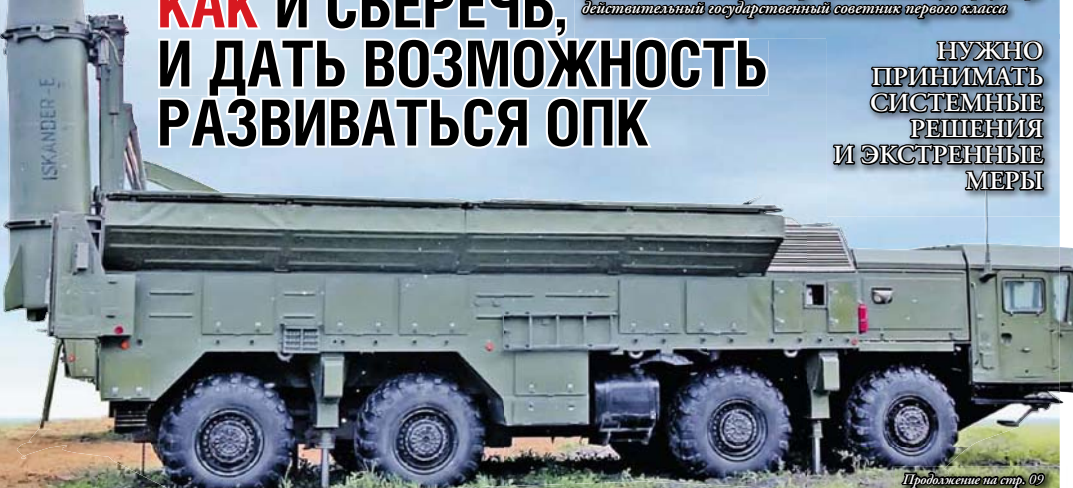
Продолжение на стр. 09

НУЖНО ПРИНИМАТЬ СИСТЕМНЫЕ РЕШЕНИЯ И ЭКСТРЕННЫЕ МЕРЫ