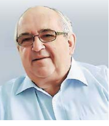
Петр СТЕГНИЙ, чрезвычайный посол, ранее — посол РФ в Турции и Израиле

Согласуясь с теми, кто отмечал, что ситуация острая и перспектива ее дальнейшего развития многовариантна. Если применить обычную дипломатическую методологию, переработать сценарии дальнейшего раз-